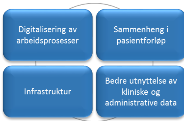
Figur 1. Strategiske satsingsområder for e-helse og IKT

satsingsområder med tilhørende ambisjon og strategiske grep for IKT. Disse fremkommer i figuren under: